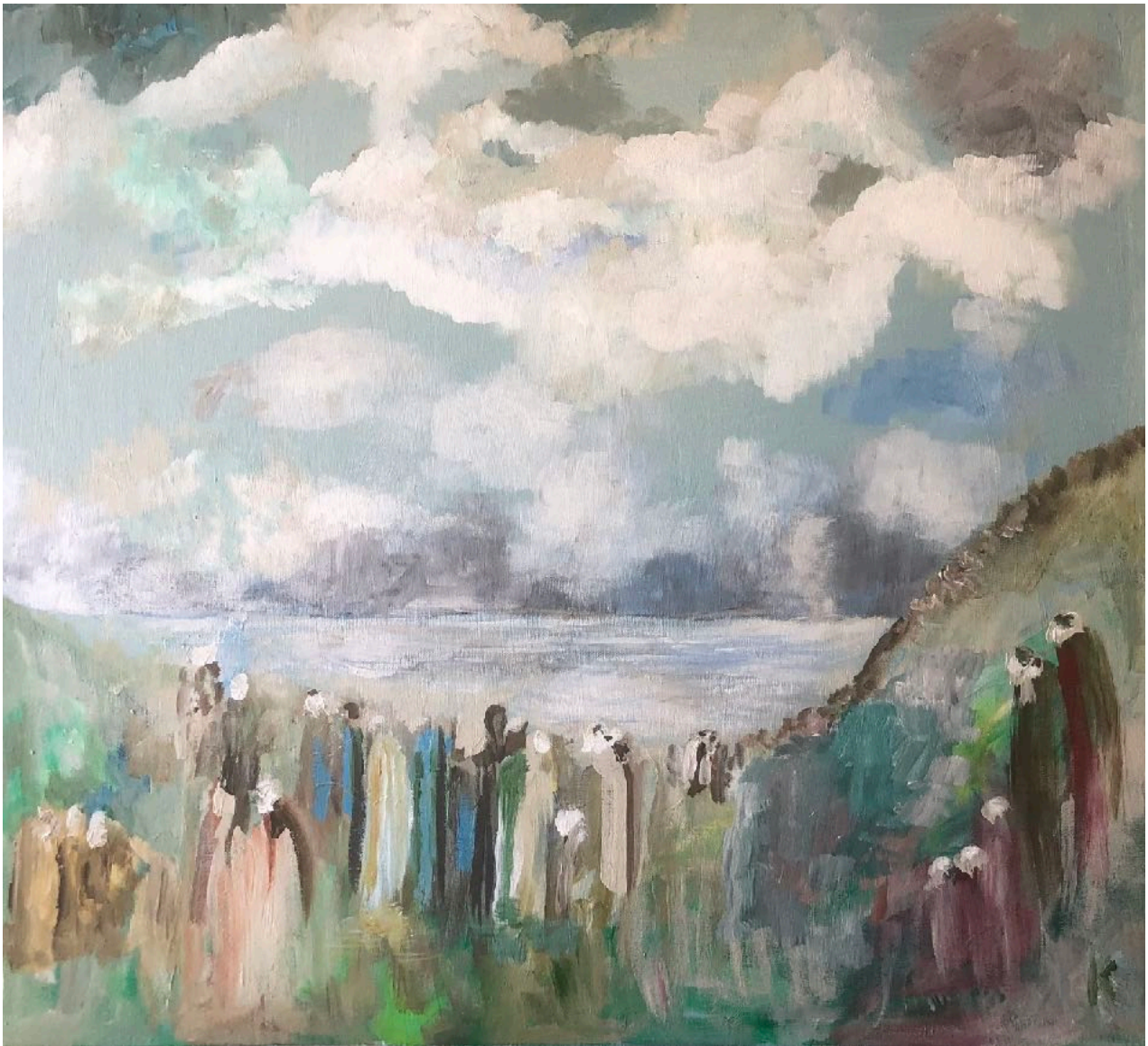
“De venter” 2022, Acryl,