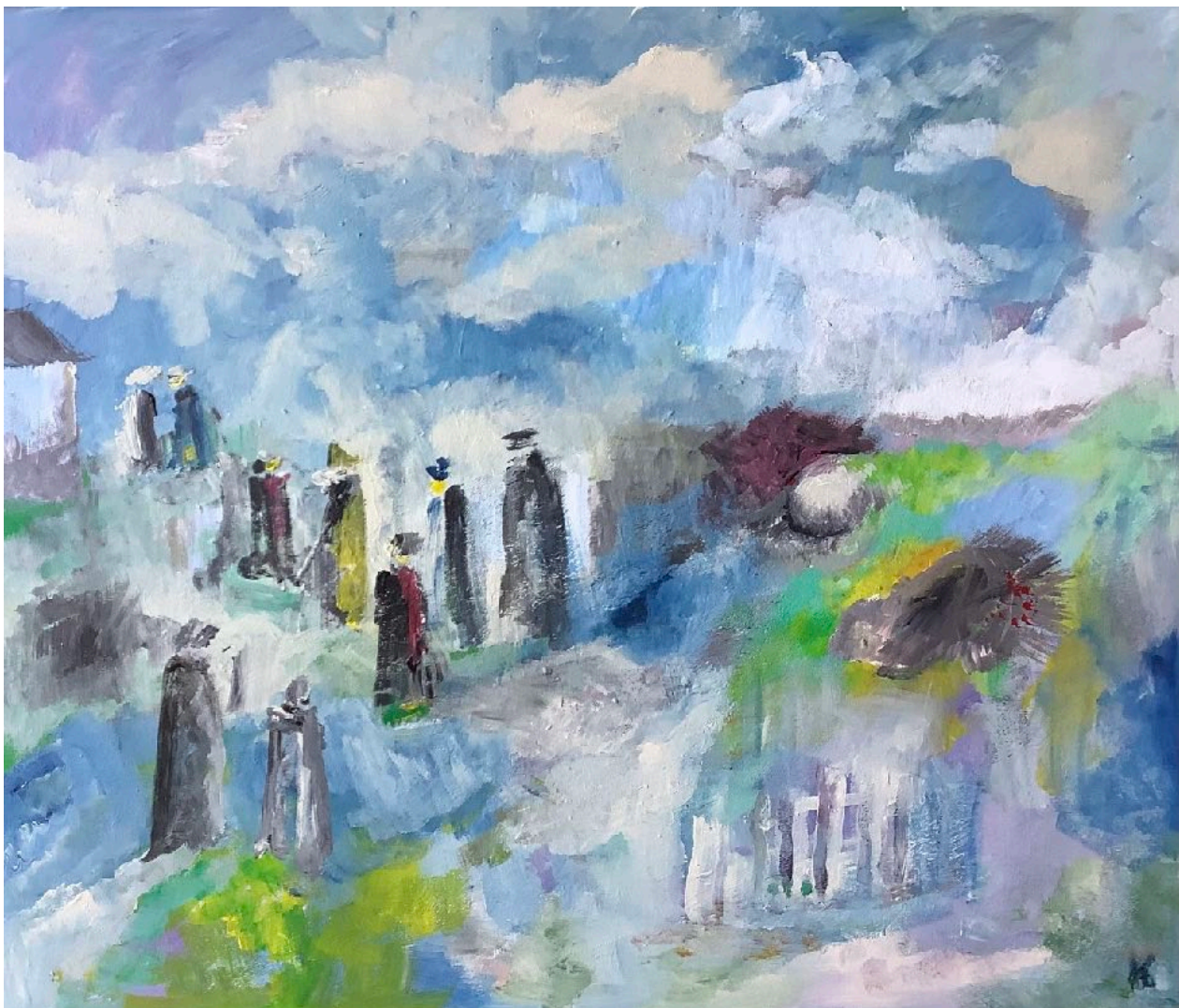
“På vej”, 2022, akryl