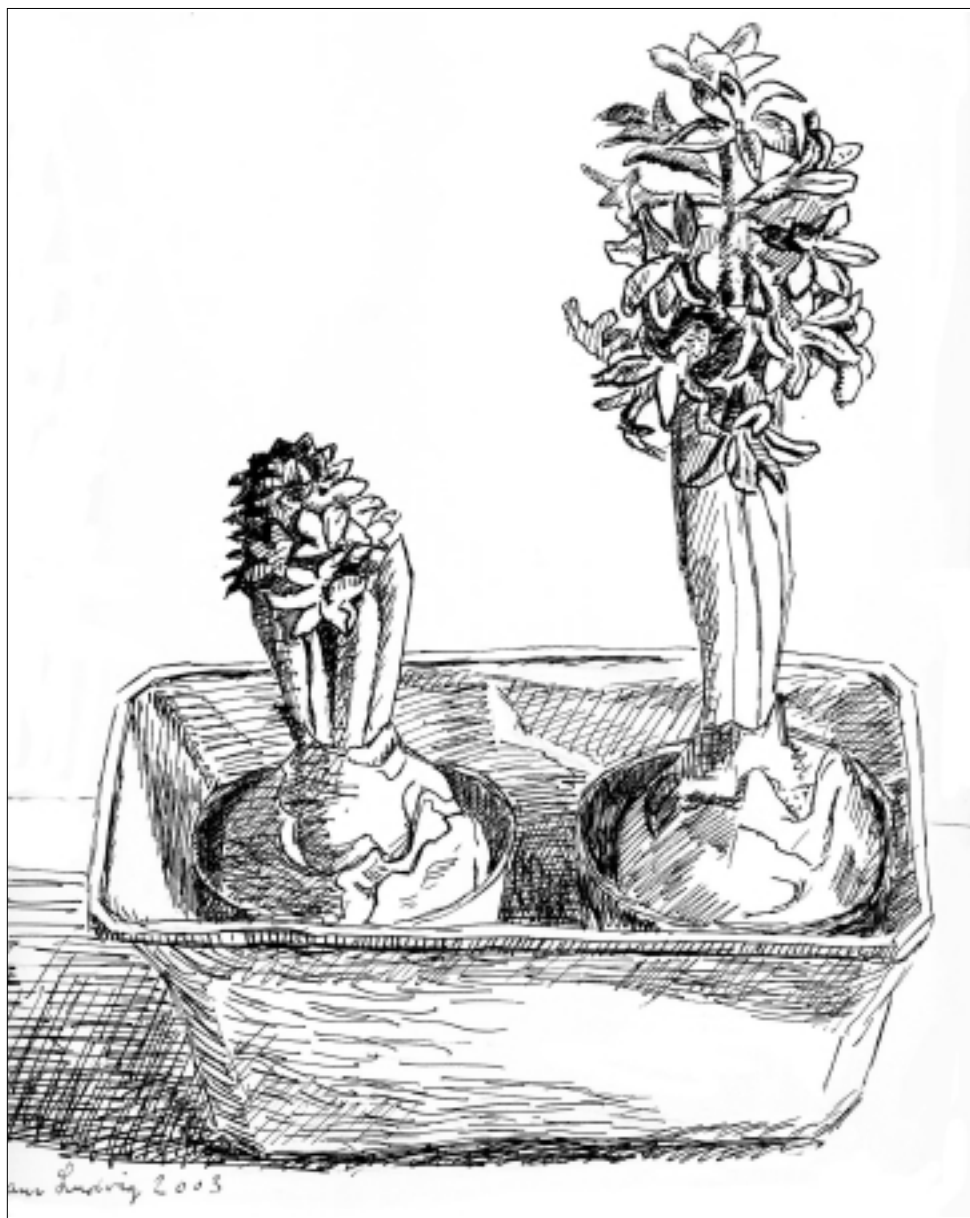
En uge senere