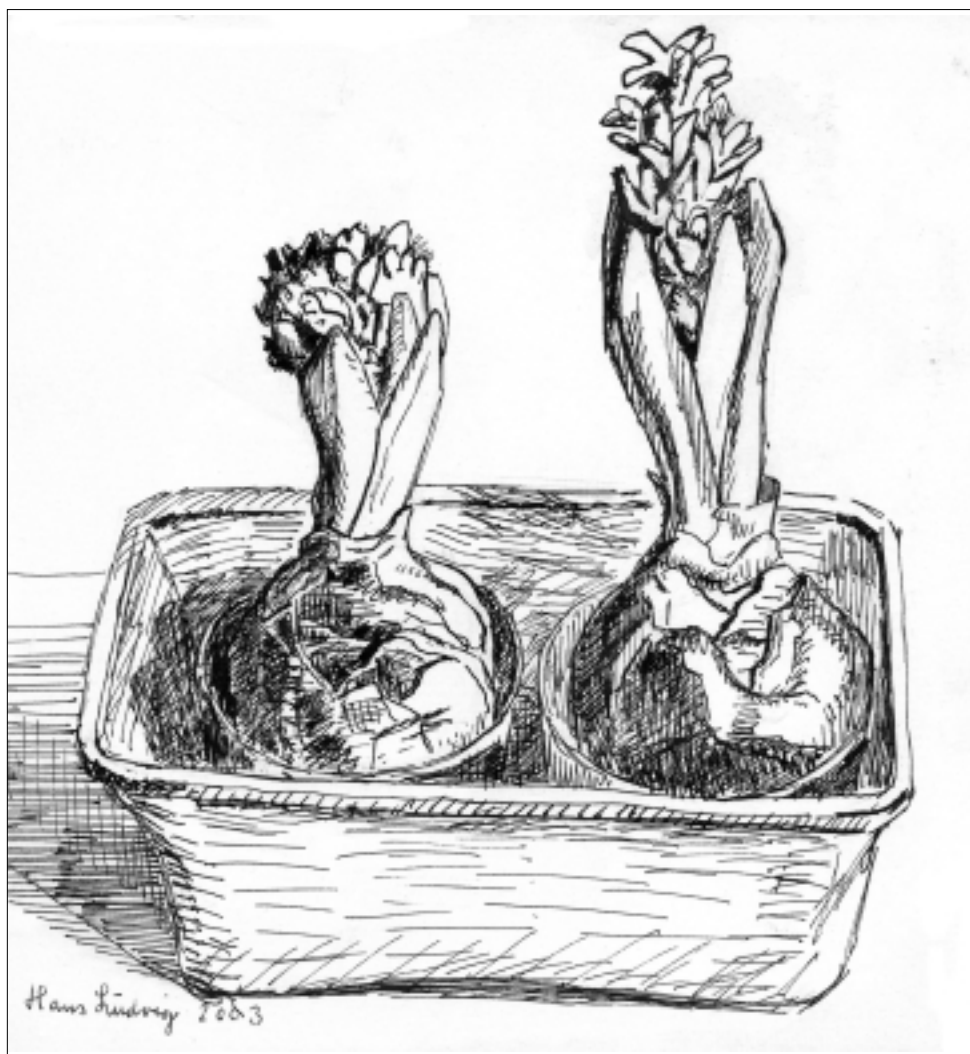
Foråret er på vej