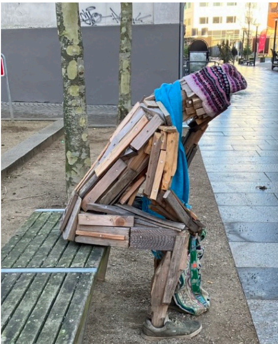
Tænkeren? Ukendt kunstner på gaden foran Randers kunstmuseum

55+'erne vil tilsvarende heller ikke føle sig gamle og ikke være så opmærksomme på deres aldring. Aldringen medfører forandringer allerede i 50 årsalderen – i fysik, tempo, kapacitet, udseende, men også i interesser, sprog, netværk..